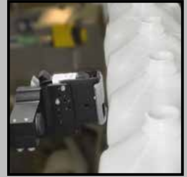
Bedrucken von Plastikflaschen