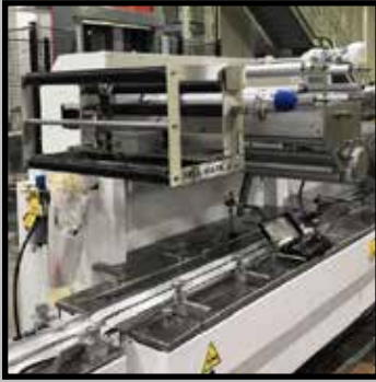
Montage auf einer kontinuierlichen Schlauchbeutelmaschine